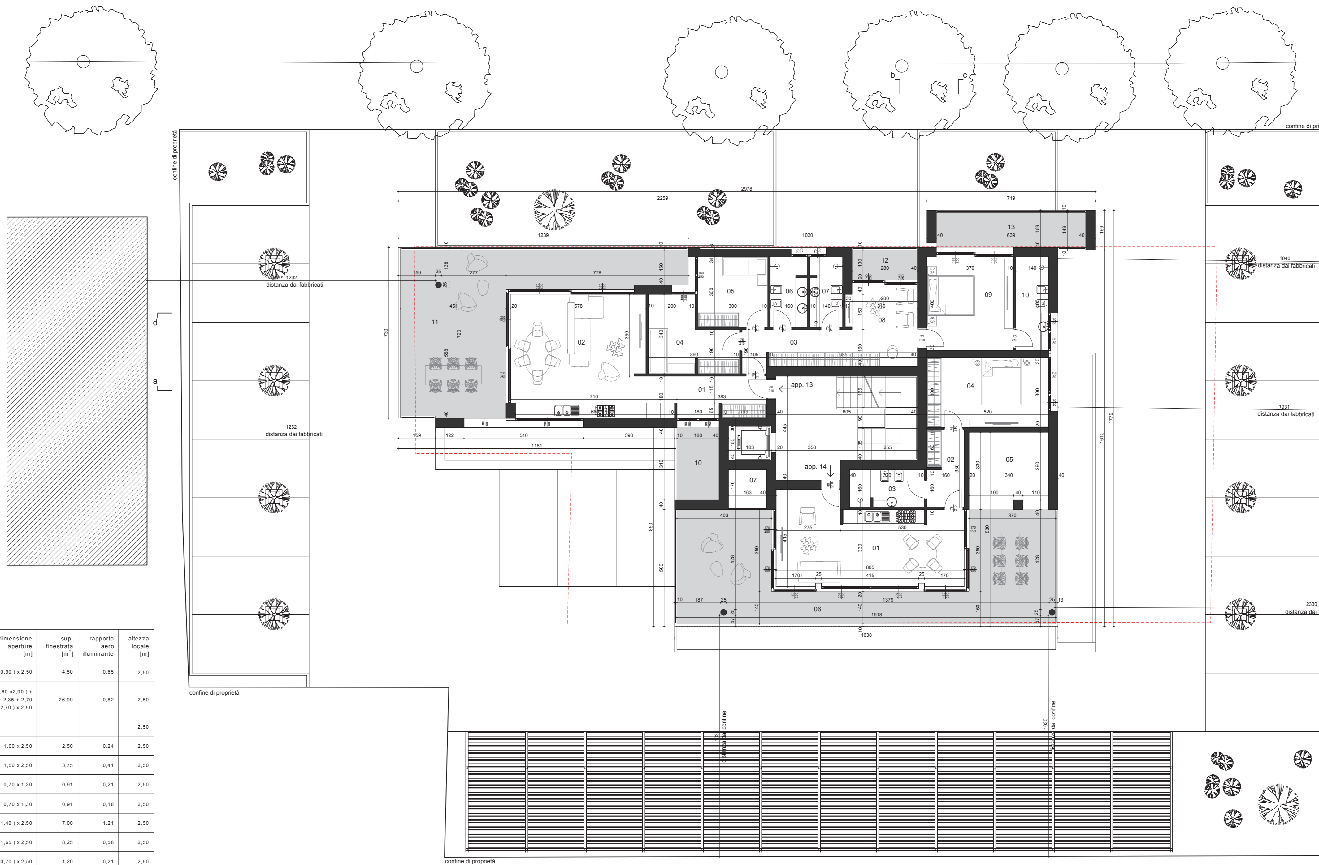
app. 14 - piano settimo