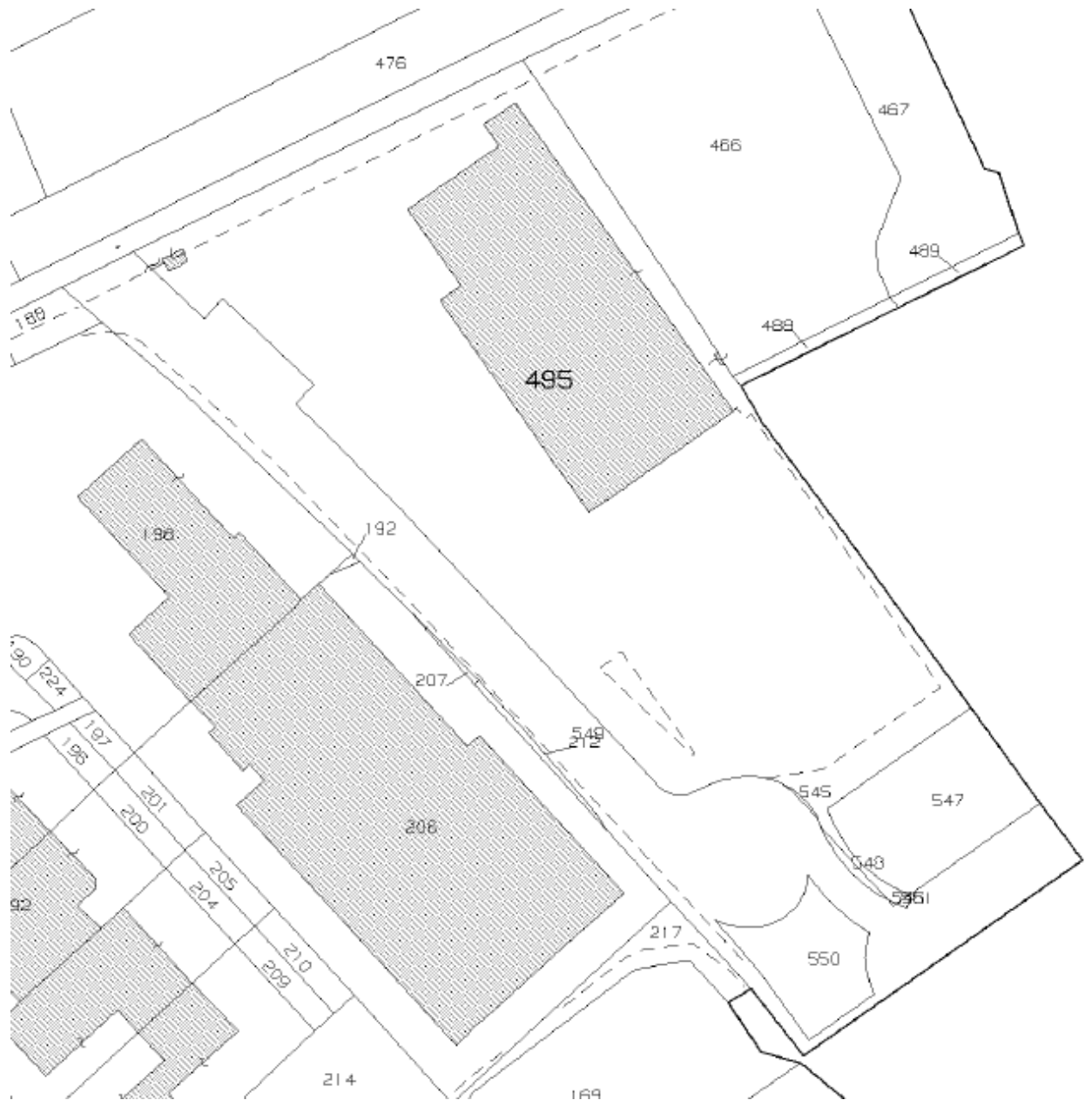
Estratto di mappa Fig. 41